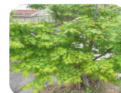
新緑のイロハモミジ

学校にもたくさんの決まりやルールがあります。子供達には、 学校での集団生活を通して、決まりやルールを守る態度や人との関わり方を学んでほしい と思います。そのことは学校だけでは身につけません。家庭や地域でもご支援ご協力をお願いいたします。